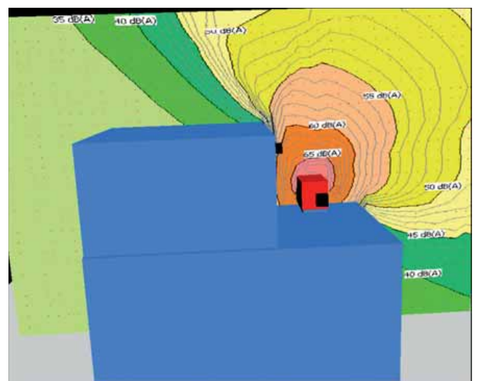
Schallausbreitung mit Schallhauben