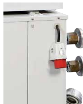
Elektroanschluss mit CEE-Stecker

Luftgekühlter Flüssigkeitskühler zur Aufstellung im Freien in korrosionsbeständiger Ausführung. Die Einheit dient zur mechanischen Kaltwasser-/Flüssigkeitskühlung und ist mit lauffähigen Scrollverdichtern ausgestattet. Der Flüssigkeitskühler verfügt über eine im Gerät integrierte Kaltwasserpumpe mit einer Förderhöhe von 1m (10kPa), sollte auf einer waagerechten, tragfähigen Fläche im Freien aufgestellt werden und zu allen Seiten mindestens 1m Freiraum haben. Die komplette Steuerung und Regelung ist im Gehäuse integriert.