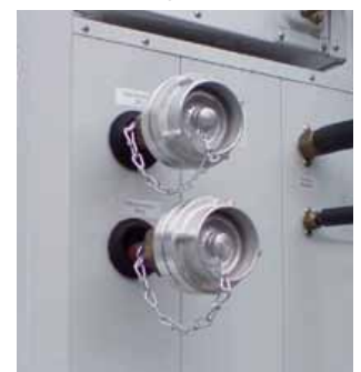
Kaltwasseranschluss mit Storz-Kupplungen