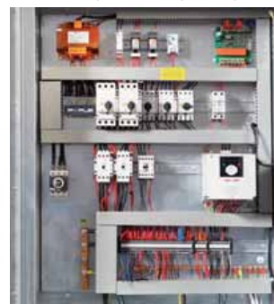
Elektroschaltschrank mit Anschluss

Luftgekühlter Flüssigkeitskühler zur Aufstellung im Freien in korrosionsbeständiger Ausführung. Die Einheit dient zur mechanischen Kaltwasser-/Flüssigkeitskühlung und ist mit lauffähigen Scrollverdichtern ausgestattet. Der Flüssigkeitskühler verfügt über eine im Gerät integrierte Kaltwasserpumpe mit einer Förderhöhe von 9m (90kPa), sollte auf einer waagerechten, tragfähigen Fläche im Freien aufgestellt werden und zu allen Seiten mindestens 1m Freiraum haben. Die komplette Steuerung und Regelung ist im Gehäuse integriert.