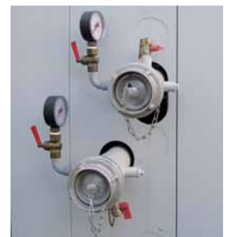
Kaltwasseranschluss mit Storz-Kupplungen