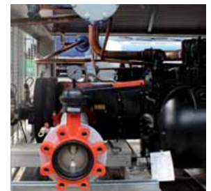
Kaltwasseranschluss mit Storz-Kupplungen