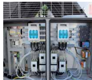
Elektroschaltschrank mit Anschluss

Luftgekühlter Flüssigkeitskühler zur Aufstellung im Freien in korrosionsbeständiger Ausführung. Die Einheit dient zur mechanischen Kaltwasser-/Flüssigkeitskühlung und ist mit lauffähigen Schraubenverdichtern ausgestattet. Der Flüssigkeitskühler verfügt über eine im Gerät integrierte Zwillingpumpe mit einer Förderhöhe von 16m (160kPa), sollte auf einer waagerechten, tragfähigen Fläche im Freien aufgestellt werden und zu allen Seiten mindestens 2m Freiraum haben. Die komplette Steuerung und Regelung ist im Gehäuse integriert.