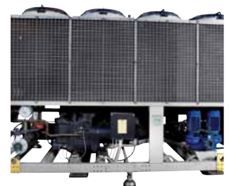
Kaltwasseranschluss mit Storz-Kupplungen