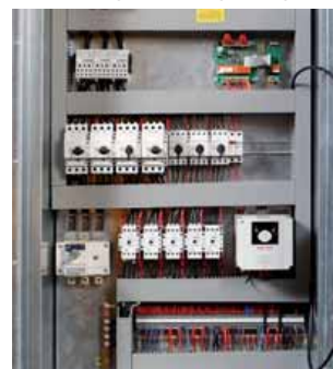
Elektroschaltschrank mit Anschluss

Luftgekühlter Flüssigkeitskühler zur Aufstellung im Freien in korrosionsbeständiger Ausführung. Die Einheit dient zur mechanischen Kaltwasser-/Flüssigkeitskühlung und ist mit lauffähigen Scrollverdichtern ausgestattet. Der Flüssigkeitskühler verfügt über eine im Gerät integrierte Kaltwasserpumpe mit einer Förderhöhe von 5m (50kPa), sollte auf einer waagerechten, tragfähigen Fläche im Freien aufgestellt werden und zu allen Seiten mindestens 1m Freiraum haben. Die komplette Steuerung und Regelung ist im Gehäuse integriert.