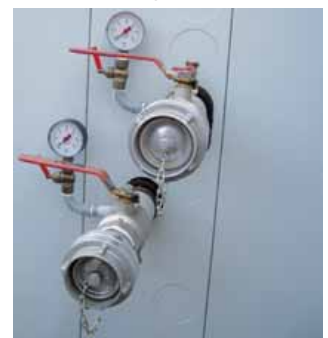
Kaltwasseranschluss mit Storz-Kupplungen